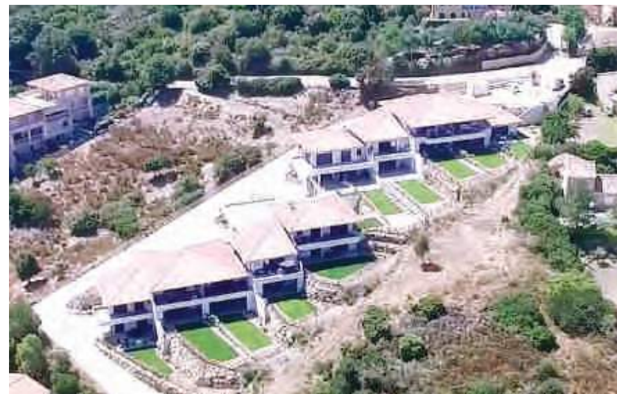
La Résidence Saint Jean