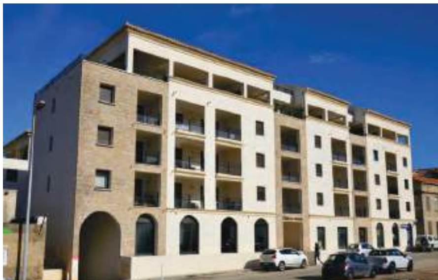
La Résidence Porto Piano